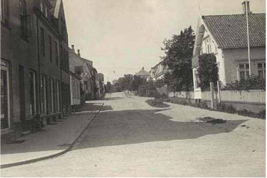
Fra Jens Zetlitz gate.

ombord, med kapteinen på toppen og dekksgutten underst. Far sa: «Du må velge mellom dekk eller maskin eller bysse. Det fineste er dekk, da kan du starte nederst og arbeide deg opp. Hvis du gjør en skikkelig jobb og oppfører deg bra, kan du bli både styrmann og kaptein. Da må du ha fartstid og gå styrmannsskolen og skipperskolen.»