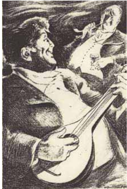
Jens Zetlitz – «Glædens Sanger»

Hvis man stiller spørsmålet om hvilken interesse Alexander L. Kielland skulle ha av å skjule at han selv var forfatteren, må det først pekes på at vi jo ikke egentlig vet om han gjorde det. Vi har ingen direkte vitnesbyrd om hva som skjedde; f.eks. kan en bemerkning om at det var et dikt i Jens Zetlitz stil ha blitt oppfattet, når det er gjenfortalt flere ganger, som om det var Jens Zetlitz verk.