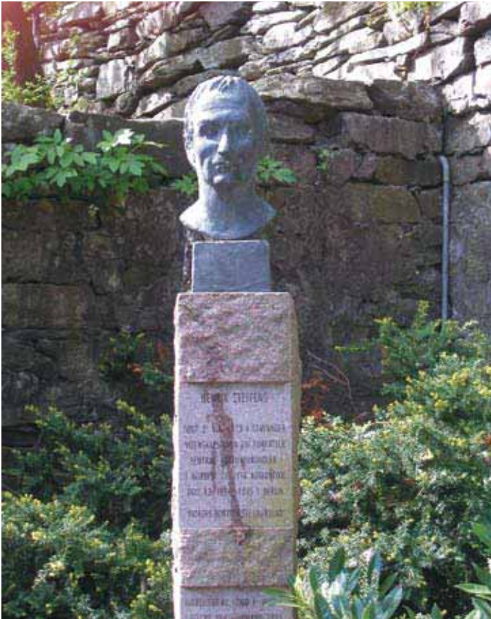
Statuen står i Løvdalssvingen, via a vis Nedre Strandgate 19.