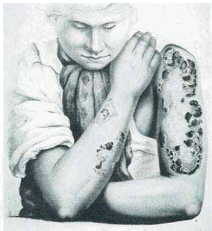
Syfilispatient i en legebok fra 1892.

Pasienter som prøvde å late som om de ikke hadde sår og sa de var friskere enn de var, skulle kroppsviseres. Det skulle føres nøye oversikt over medikamentbruk og regnskap over medisinen. Utskrifter av regnskap og hele sykejournalen skulle jevnlig oversendes amtmannen, altså fylkesmannen, for kontroll. Han skulle umiddelbart sende alle dokumenter videre til revisjon ved det medisinske kollegium.