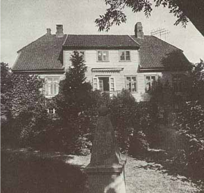
Radesykehuset som ble Kiellands- familiens bolig ved Breivatnet.

Henrik Steffens vokste opp og ble en stor filosof og forfatter ved tyske universiteter, Norges bortblæste Laurblad, som Wergeland kalte ham.