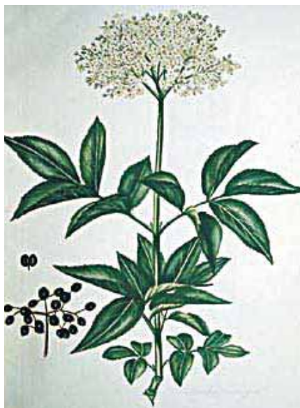
Hyllebærssaft var hyppig brukt av mange radesykehusleger i behandlingen.

den dansk-norske flåte med den alt overveiende del av sjømenn på 1600- og 1700-tallet. Angivelig skal smitten ha kommet til Norge alt i 1709 fra sjøfolk på et skip som ankret opp i nærheten av Stavanger der de «søgte conversation med den norske quindekjønn der i Havnen og omgrensede gaarde». Jeg vil anta at konversasjonen ble fulgt av en viss seksuell aktivitet!