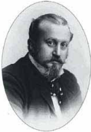
Alexander L. Kielland