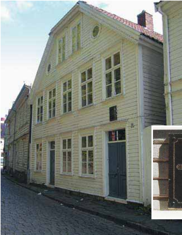
Steffenshuset – Nedre Strandgate 19.

mingsmateriale for alt senere. Det var her det begynte. Derfor er den lille hvite byen ved Vågen alltid så viktig for ham.