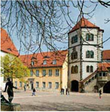
Fra Altstadt i Halle i dag.

romantikk og naturfilosofi, mens Halle var en luthersk-pietistisk høyborg.