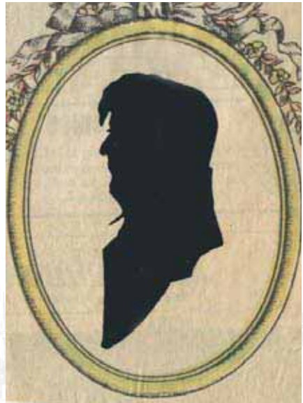
Silhuett av Jens Zetlitz.

Språkformen i diktet, slik det er gjengitt ovenfor tilhører en senere tid enn Jens Zetlitz, og for så vidt også en senere tid enn