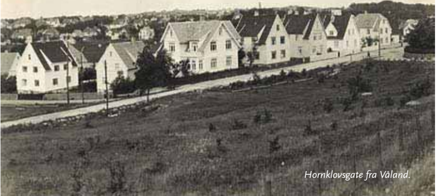
Hornklovsgate fra Våland.

Forfatteren er pensjonert lektor fra Eik Lærerhøgskole. Faren, som var fra Egersund, ble ansatt ved Porsgrunn postkontor i 1918, og samme året kjøpte de nylig gifte foreldrene hans et lite hus med hage på Bjørntvedt i Porsgrunn; et rolig villastrøk med grusveier og grønne grøftkanter.