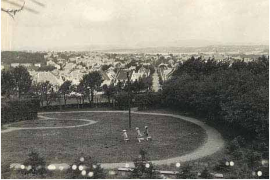
Barn i lek på Våland.

de store skorsteinene som dampbåtene hadde. De så ut som store racerbåter, eller nesten som krigsskip. Å reise med dem var som å sitte i en buss! Fjordbusser ble de kalt. Når skulle vi ta en tur med dem?