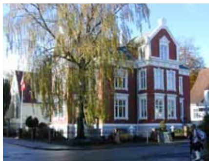
Nils Juels gate 20, tidligere Dronningens gate 45. bl.a kjent som Domkirkens gamlehjem og Stavanger kommunes diagnosestasjon.

Denne bygningen hadde fram til midten på 2000-tallet adresse til Dronningens gate som nr 45. Tidligere Dronningens gate fra St. Olavs gate til Kannik skole har skiftet navn til St. Svithuns gate. Bygningen er fra 1902/03 i historisk stil og i 1910 ble eiendommen overtatt av «Domkirken kirkelige fattigpleie». Dette var det første aldershjem drevet av en menighet i Stavanger.