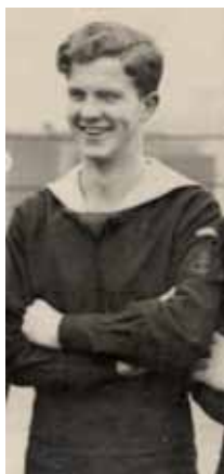
I London 1943

etter dette, men sent torsdag kveld 19. april stod den 21-årige fenriken enda en gang i spissen for en uhyre dristig kapring rett foran nesen på fienden. To lasteskip ble ført til nøytral svensk havn. Det ene var D/S «Activ» som tilhørte Brødrene Olsen i Stavanger. Tyskernes sjøkapasitet var blitt kraftig redusert.