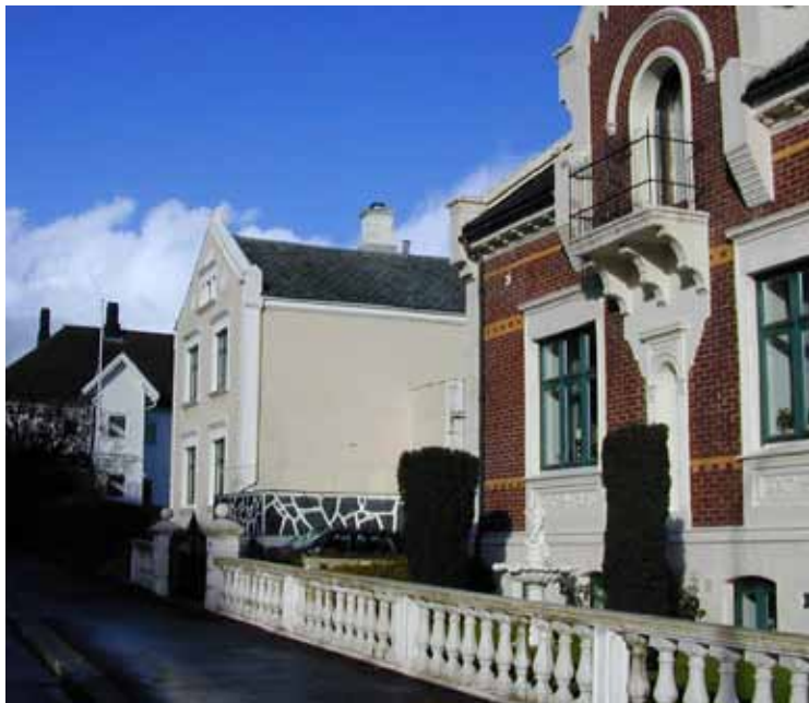
Fra Gjøsteins gate. I midten nr 7.