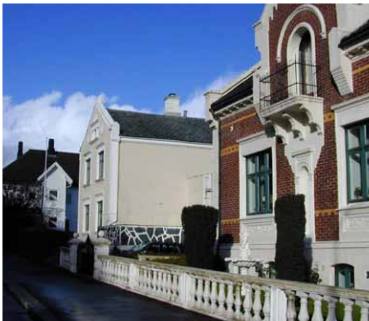
Fra Gjøsteins gate. I midten nr 7.