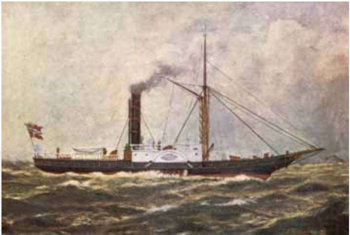
Dampskipshjulbåten "Ryfylke" som ble satt i drift i 1855, den tiden som denne artikkelen omhandler. Bildet er hentet fra boken "Det Stavangerske Dampskibsselskab 1855-1955".