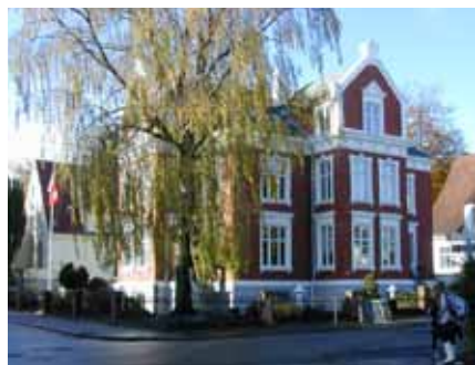
Nils Juels gate 20, tidligere Dronningens gate 45. bl.a kjent som Domkirkens gamlehjem og Stavanger kommunes diagnosestasjon.

Denne bygningen hadde fram til midten på 2000-tallet adresse til Dronningens gate som nr 45. Tidligere Dronningens gate fra St. Olavs gate til Kannik skole har skiftet navn til St. Svithuns gate. Bygningen er fra 1902/03 i historisk stil og i 1910 ble eiendommen overtatt av «Domkirken kirkelige fattigpleie». Dette var det første aldershjem drevet av en menighet i Stavanger.