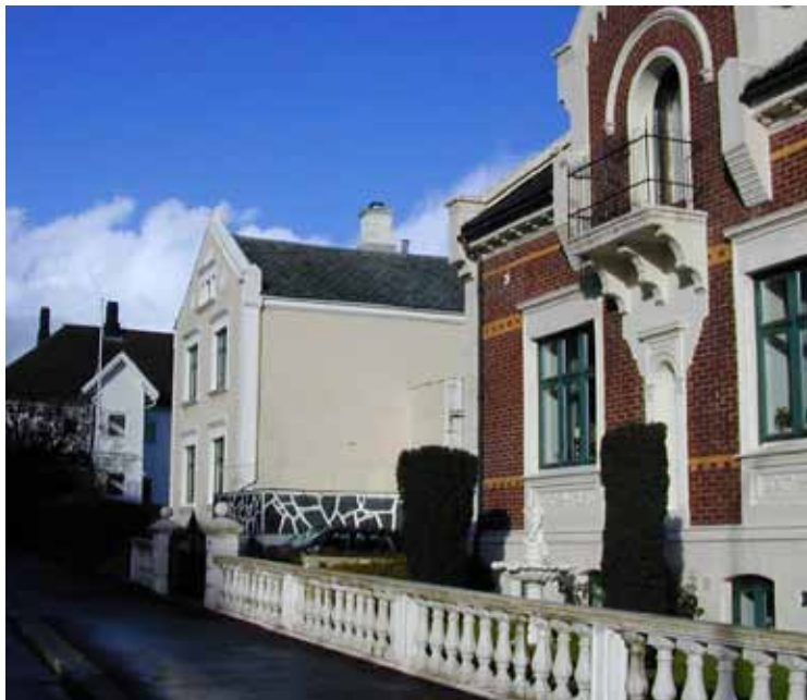
Fra Gjøsteins gate. I midten nr 7.