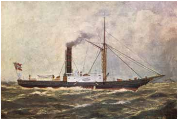
Dampskipshjulbåten "Ryfylke" som ble satt i drift i 1855, den tiden som denne artikkelen omhandler. Bildet er hentet fra boken "Det Stavangerske Dampskibsselskab 1855-1955".