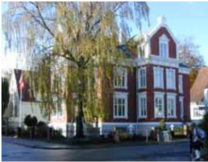
Nils Juels gate 20, tidligere Dronningens gate 45. bl.a kjent som Domkirkens gamlehjem og Stavanger kommunes diagnosestasjon.

Denne bygningen hadde fram til midten på 2000-tallet adresse til Dronningens gate som nr 45. Tidligere Dronningens gate fra St. Olavs gate til Kannik skole har skiftet navn til St. Svithuns gate. Bygningen er fra 1902/03 i historisk stil og i 1910 ble eiendommen overtatt av «Domkirken kirkelige fattigpleie». Dette var det første aldershjem drevet av en menighet i Stavanger.