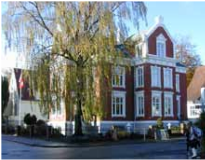
Nils Juels gate 20, tidligere Dronningens gate 45. bl.a kjent som Domkirkens gamle hjem og Stavanger kommunes diagnosestasjon.

Denne bygningen hadde fram til midten på 2000-tallet adresse til Dronningens gate som nr 45. Tidligere Dronningens gate fra St. Olavs gate til Kannik skole har skiftet navn til St. Svithuns gate. Bygningen er fra 1902/03 i historisk stil og i 1910 ble eiendommen overtatt av «Domkirken kirkelige fattigpleie». Dette var det første aldershjem drevet av en menighet i Stavanger.