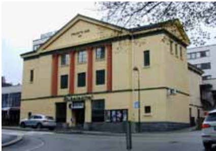
Folkets Hus/Folken. Arkitekt Gustav Helland har ansvaret for den første delen fra 1925, mens arkitektene Retzius og Bjoland sto for påbyggingene i 1962 og 1988.

Folkets Hus med Folketeatret og kontorer og møtelokaler for fagbevegelsen og Arbeiderpartiet ble bygd ut i tre steg: Første del sto ferdig til innvielse i 1926, annet trinn med møtelokaler og kontorer sto ferdig 1962, og med høybygget mot Engelsminegata og Jens Zetlitzgate ferdig i 1981 var hele kvartalet mellom Løkkeveien, Ny Olavskleiv og Jens Zetlitzgate bebygd. I dag er deler av kontorarealene i høybygget leid ut på forretningsmessig grunnlag. Siden 1983 har den nyklassisistiske folketeaterbygningen vært disponert av Studentersamfunnet i Stavanger og er kjent under navnet Folken.