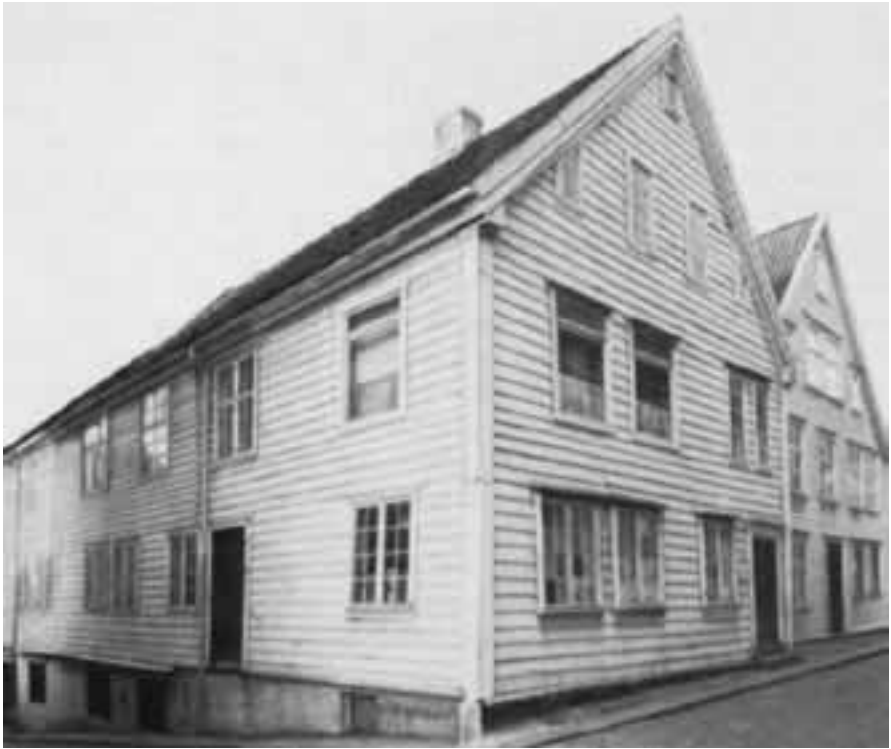
Nedre Strandgt. 9 som denne historien forteller om. Etter å ha vært eiendommen til handelshuset Jacob Kielland & Søn i nesten 100 år, ble det solgt til familien Svendsen. Senere også kalt «Svendsahuset».