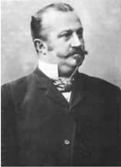
Alexander L. Kielland hadde mange opplysninger om tip-tip oldefarens første hus i Stavanger