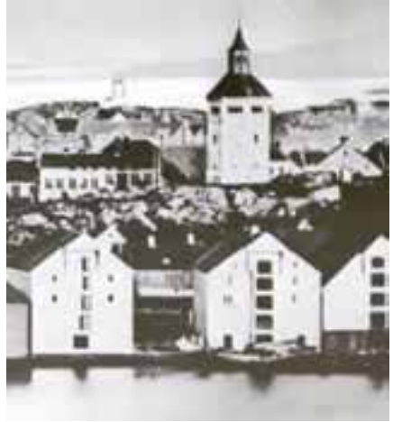
Valbergtårnet i 1880-årene.