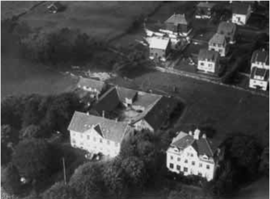
Misjonsskolen på Kampen. Den store løen ble revet i ca. 1980.

(1886—1967, prof. i anatomi Universitetet i Oslo 1919—52, rektor Universitetet i Oslo 1945—52, styrer av Universitetets arvelighetsinstitutt 1938—52. Tok initiativet til opprettelsen av Norges almenvitenskapelige forskningsråd).