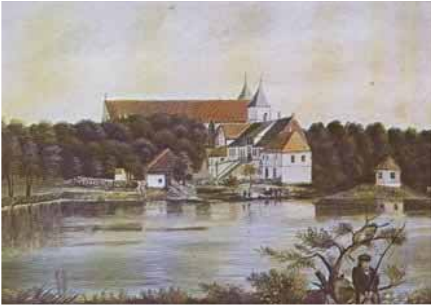
Kongsgård med Domkirken 1831.

skapte grunnlag for andre religiøse og verdslige institusjoner. Men som handels-sentrum ble Stavanger liggende i skyggen av hansabyen Bergen i nord. Bergenserne kontrollerte handelen med de enormt rike fiskeressursene fra kysten nordover langs landet. Byene på Sørlandet og Østlandet eksporterte trelast og jern til det europeiske kontinentet. Borgerne i Stavanger derimot, greide ikke å få tilgang til et overskudd av en handelsvare som kunne omsettes med utenverdenen og skape økonomisk vekst.