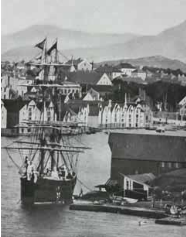
Stavanger havn i 1880-årene.