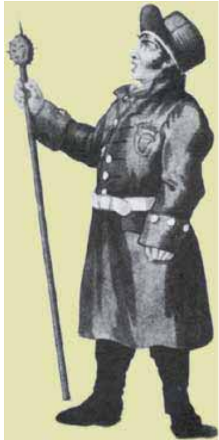
Vekter med sitt symbol og våpen; Morgenstjernen

Vekterne ba om å få vinduer i tårnet slik at de kunne se ut uten å måtte åpne tre-