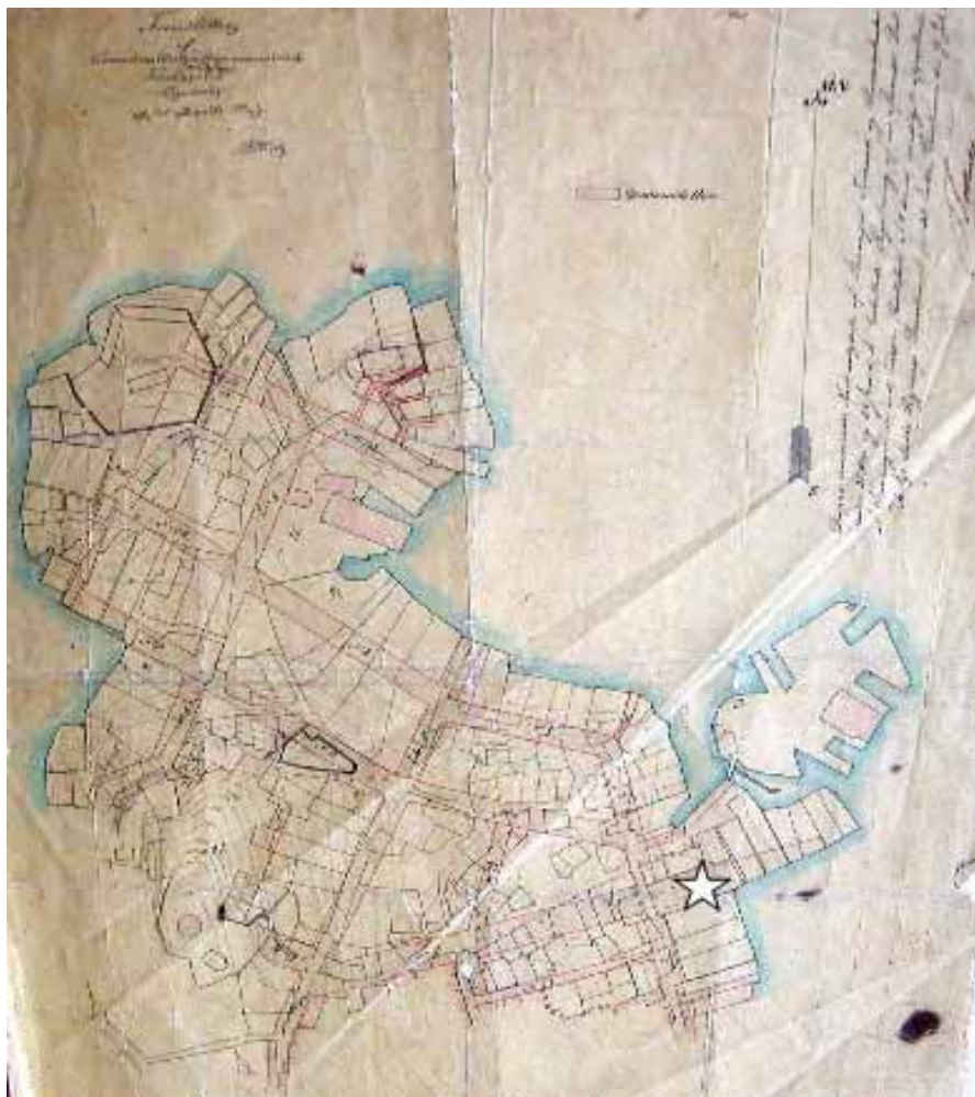
Premierløytnant Hielms opptatte kart over brannstedet. De nye gatene er inntegnet med rød farge; bl.a. Bakkegt., Breigt., Øvre og Nedre Holmegt. «Stjernen» angir stedet hvor brannen oppstod; nedre delen av nåværende Breigt. (Bildet er avfotografert på Byarkivet)

vindstille, tok det bare godt og vel en time før ilden var under kontroll. Men etter at faren var over, utbrøt en gammel kone: «Vårherre ville denne gang bare vise oss riset!» Det lød som en uhyggelig profeti som snart skulle gå i oppfyllelse.