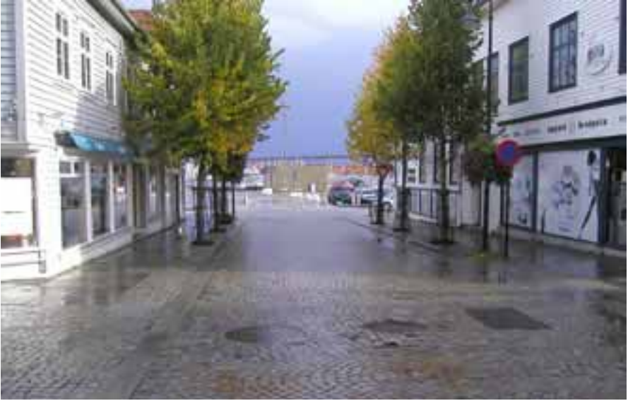
Dette bildet har jeg tatt av dagens nedre del av Breigt. Her lå Wasbøe – huset i 1860, og her var det Store'braen oppstod.

titarius videre Tiltale fri at være, dog saaledes at at han udreder alle af hans Arrest og Sagens flydende Omkostninger og deriblandt i Salærium til Referenten Procurator Hansen 30 Spd., foruden de denne under Thingsvidnet i Jæderen og Dalerne tilkjendte 10 Spd. at utredes efter Øvrighedens Foranstaltning under Adfærd efter Loven.»