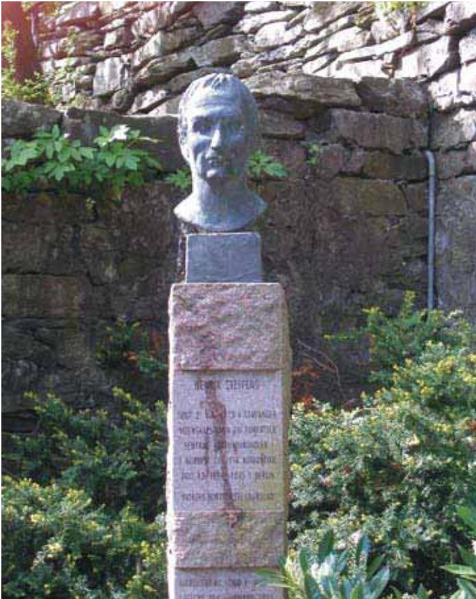
Statuen står i Løvdalssvingen, via a vis Nedre Strandgate 19.