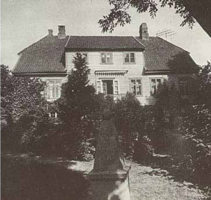
Radesykehuset som ble Kiellands- familiens bolig ved Breivatnet.

Henrik Steffens vokste opp og ble en stor filosof og forfatter ved tyske universiteter, Norges bortblæste Laurblad, som Wergeland kalte ham.