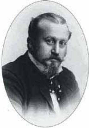
Alexander L. Kielland