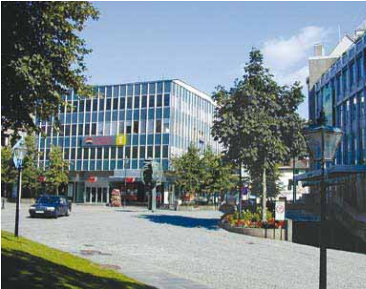
Domkirkeplassen