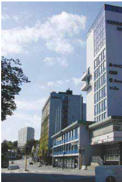
Olav Vs gate – tidligere Jernbaneveien