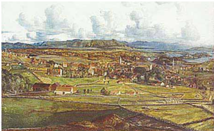
«Stavanger sett fra Våland», malt 1865.

Da Hertervig vendte hjem fra Düsseldorf i 1854, gikk han fra Kristiansand til Stavanger, for ikke å belaste Sundts konto mer enn nødvendig. Dette hadde Sundt vondt av, og han bebreidet sin kunstnervenn for hans spinking og sparing, men Hertervig svarte slukøret at Sundt hadde hatt nok utlegg og besvær med ham. Seinere rømte Hertervig når han oppdaget Sundt i nær-