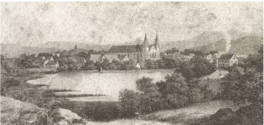
Breiavatnet fra syd, ca. 1830.