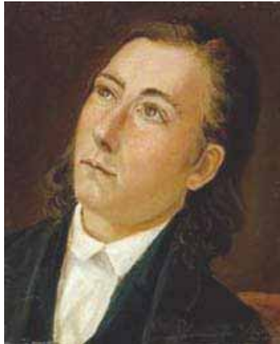
Nils Bjørn Møller Portrett av Lars Hertervig 1851, Nasjonalgalleriet