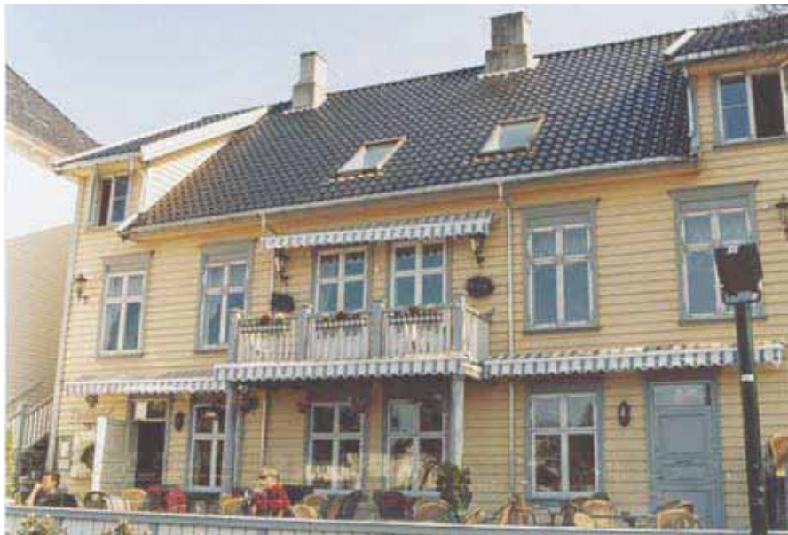
Charlottenlund i dag.

kan renses – alt kan farges. 17-mai-flekker borttages». Nesting bygde på både bolig- hus og sitt renseri ned mot vatnet i 1910, og en skorstein skapte inntrykk av industrialisering ved Breiavatn-idyllen. Fargeriet var ikke like populært blant alle byens innbyggere da en kunne se på vannflaten hvilke farger Nesting nyttet seg av til sine fargede stoffer, noe som varierte fra dag til dag. Før hadde garverne sørget for å forurense vatnet, nå overtok Nestings fargerier. 19. september 1917 ble fabrikkbygningen i Kongsgata skadet av brann. Nesting orket ikke å starte på nytt igjen, og han solgte derfor Kongsgata 45 til Stavanger kommune for 106 000 kroner i 1917 (08.08).