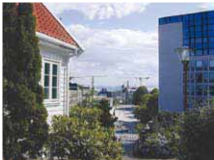
Haakon VII's gt fra Kleivaparken