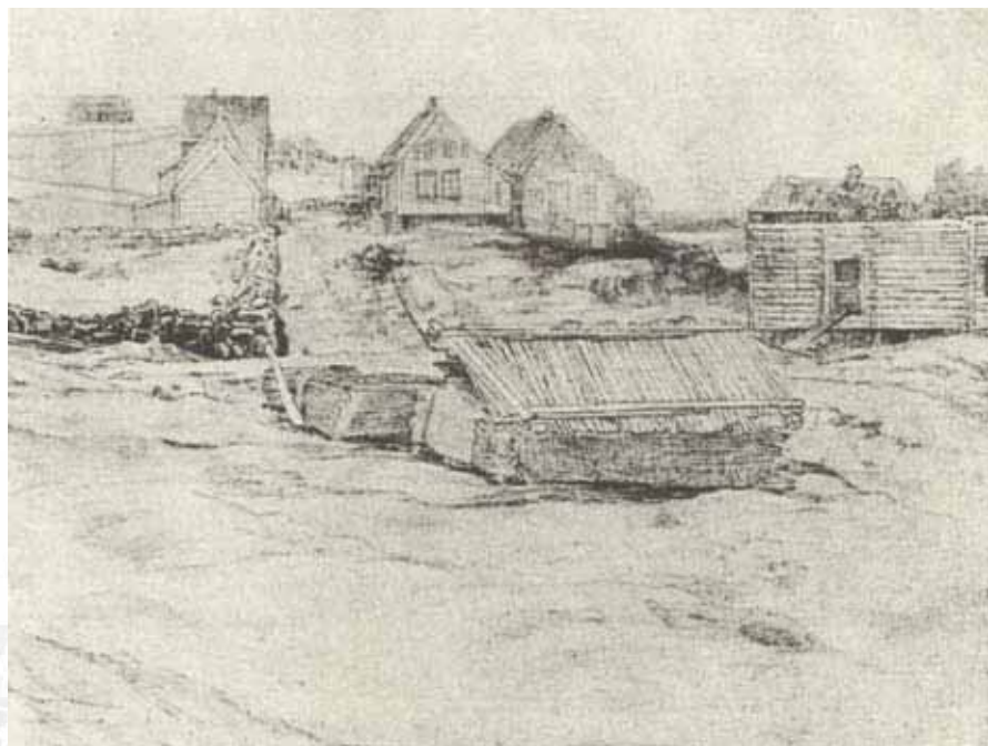
Fra Sandviken. Fra skissebok II. Nasjonalgalleret, Oslo.