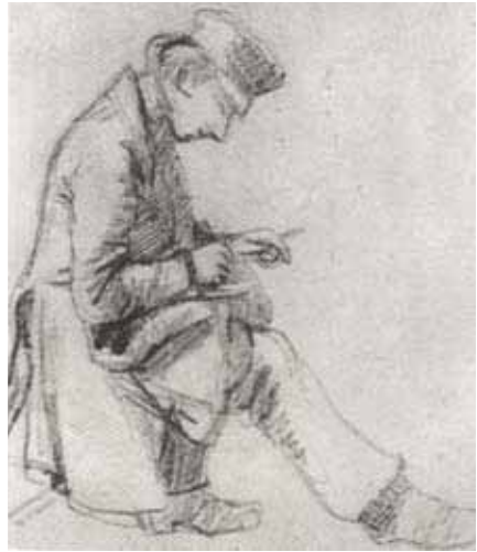
Peter Nicolai Arbo: Skisse av Lars Hertervig som tegner.