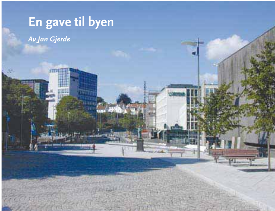
Haakon VII's gate fra Domkirkeplassen.

Det vekker oppmerksomhet og fører til medieomtale når velbeslårte borgere gir store pengegaver til gode formål for byen. Da stiller ordføreren opp med kjede og honoratiorene står på rekke og rad og lar seg avbilde med slips og brede smil. Og takk fortjener de, selv om det ikke er tale om den fattige enke som ga begge sine mynter til tempelbørsen. For det er nemlig slik at denne byen også får store gaver som ikke teller i budsjettene.