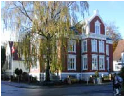
Nils Juels gate 20, tidligere Dronningens gate 45. bl.a kjent som Domkirkens gamle hjem og Stavanger kommunes diagnosestasjon.

Denne bygningen hadde fram til midten på 2000-tallet adresse til Dronningens gate som nr 45. Tidligere Dronningens gate fra St. Olavs gate til Kannik skole har skiftet navn til St. Svithuns gate. Bygningen er fra 1902/03 i historisk stil og i 1910 ble eiendommen overtatt av «Domkirken kirkelige fattigpleie». Dette var det første aldershjem drevet av en menighet i Stavanger.