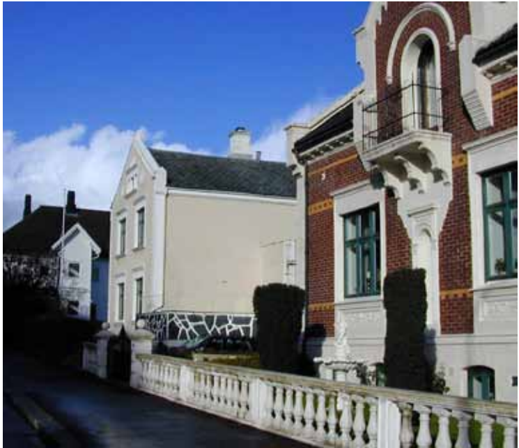
Fra Gjøsteins gate. I midten nr 7.