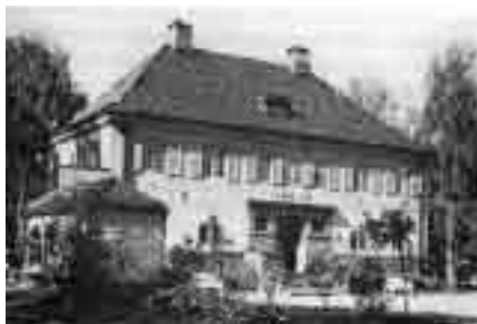
Den gamle bygningen til Nansenskolene

men holdt helstøpte, beåndede forelesninger, som nesten satte elevene i ekstase. De kunne ikke diskutere etter foredragene, i alle fall ikke med en gang, så betatte var de.”