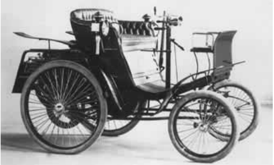
Stavangers første bil.

Få er vel egentlig klar over hvilken betydning Stavanger-distriktet har hatt for den motoriserte samferdsel i Norge. Pionertiden i norsk bilhistorie går fra siste del av 1800-tallet og frem til 1909 da den første bilutstillingen fant sted her i landet, og i denne utviklingen har Stavanger en sentral plass.