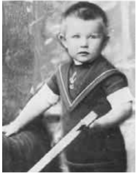
Som 3 åring i Stavanger i 1887

Personen som rådsnart og elegant løste opp denne lett traumatiske floken som oppstod, skulle etter hvert markere seg som en av de mest betydelige kulturpersonligheter og kirkeledere i Norge på 1900 – tallet. Han kom til verden her i Stavanger i skjebneåret 1884 hvor hele vår samfunnsordning var under omdannelse,