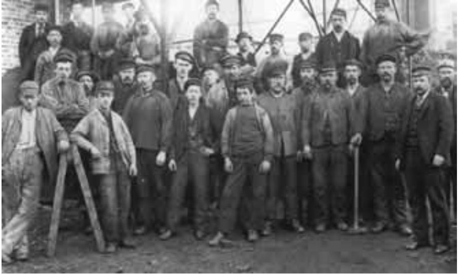
Maskinarbeidere og kjelesmeder ved Rosenberg Mekaniske Verksted i Sandviken fotografert rundt 1900.

er innsiktsfull og kunnskapsrik utover bokens kjernestoff. Hans analyser av utviklingstrekk og sammenhenger er preget av at han har en genuin forståelse av de prosesser som styrer samfunnsutviklingen og hvordan ting griper inn i hverandre. En slik forståelse er ikke helt vanlig, særlig ikke i akademiske kretser.