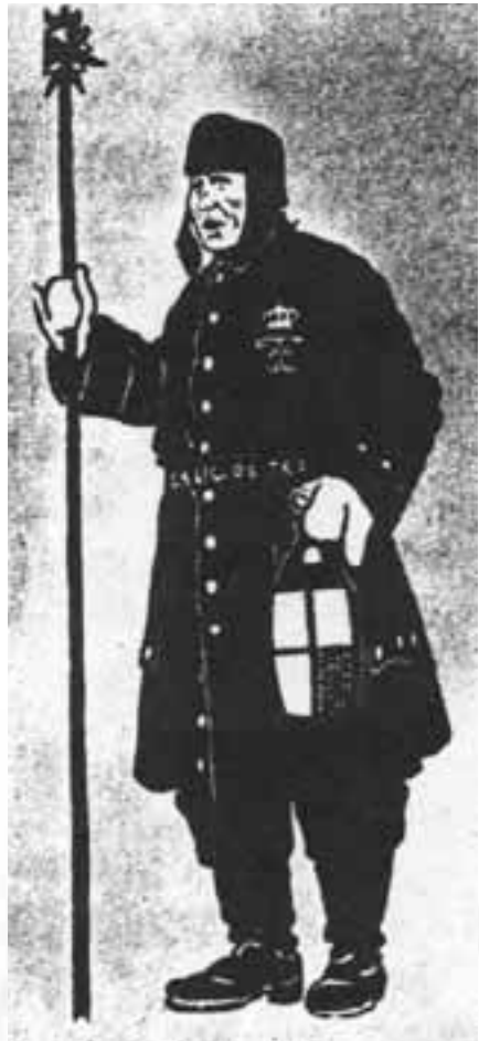
Vekter med utstyret sitt.

Rådhuset dannet rammen om byens kommunale liv fra 1594 til 1864. Vanligvis var det to borgermestere og fire rådmenn