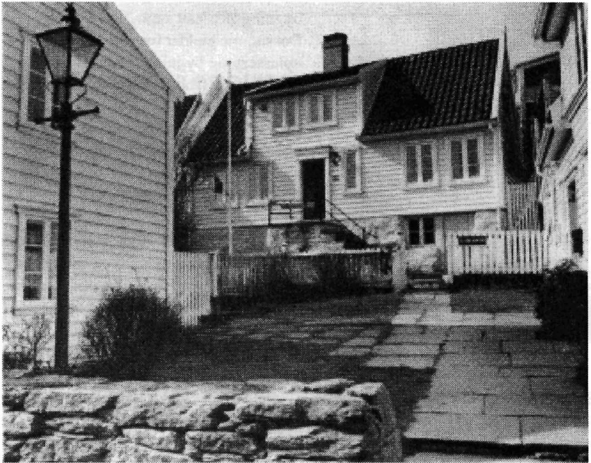
Øvre Strandgate 80a etter rehabilitering.