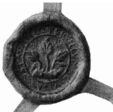
Signeten fra 1591