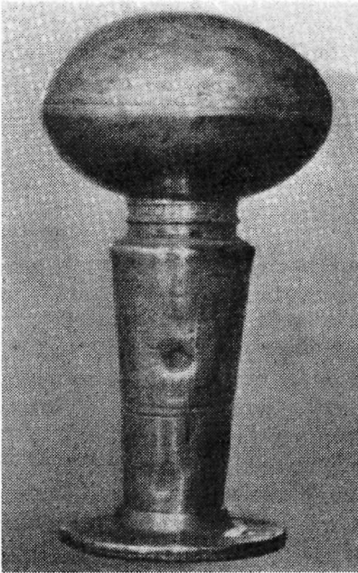
Signeten fra 1591