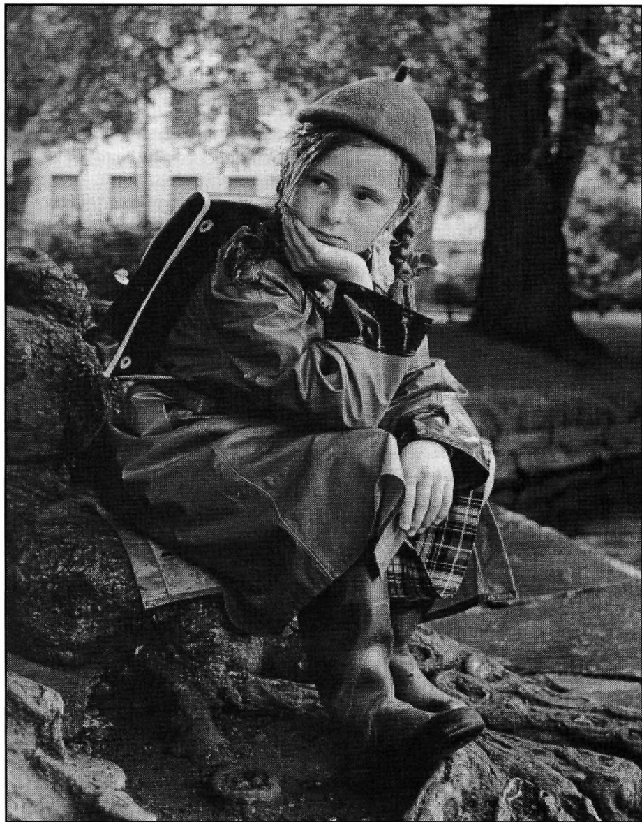
Fra innspillingen av «Toya» filmen i Byparken Fra boken «Kunst og kasse».