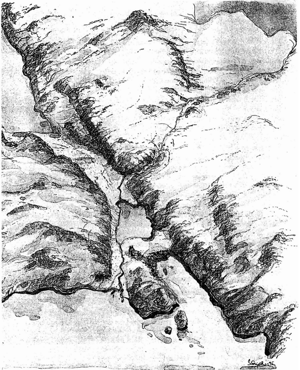
Skissen viser en rekonstruksjon av det opprinnelige Landskap ca år 1350 e. Kr. Utført av landskapsarkitekt Sveinung Skjold for Stedsanalyse Stavanger sentrum 1994.